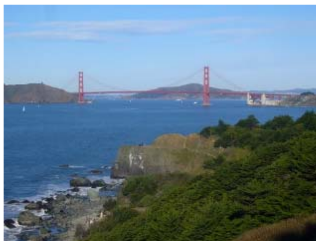
Голден Гейт Парк (Парк «Золотые ворота»)

«Биг Уан» является и движением и совместным проектом, разработанном группой некоммерческих организаций (НКО) и представителей общества в районе залива Сан-Франциско. Каждый год в июне, проводится двух дневное некоммерческое мероприятие в парке «Голден Гейт», направленное на построение сети сотрудничества между сообществами, а также на позитивные социальные изменения и устойчивое развитие. Это мероприятие включает «Поселок решений», находящийся в парке, где НКО из нашего региона могут собираться в больших палатках по разным темам, в которых представляют свои ресурсы и предлагают свои решения. Более 7,500 некоммерческих организаций предлагают услуги в районе залива.