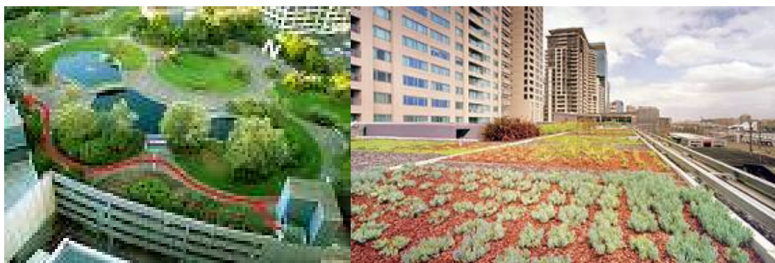
Сад на крыше (rooftop garden)

Бей Локалайз является некоммерческой организацией, которая способствует развитию устойчивого и социально справедливого сообщества в районе залива Сан-Франциско. Ее деятельность направлена на то, чтобы ускорить переход от глобальной, опирающейся на ископаемое топливо экономики, которая не столько обогащает, сколько уничтожает, к локализованной зеленой экономике, которая укрепляет все сообщества в нашем